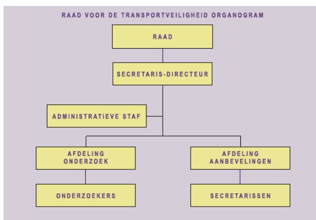
Figuur 1: Organogram Raad voor de Transportveiligheid

Onder de RvTV ressorteerden vier kamers, te weten een kamer voor scheepvaartongevallen, luchtvaartongevallen, railverkeersongevallen en verkeersongevallen op de weg. Er is sprake geweest van de oprichting van een vijfde kamer, die van buisleidingen. Deze is er niet gekomen. Wel bestond er een Commissie Buisleidingen, die formeel onder de Kamer Railverkeer viel. De organisatie van de RvTV is weergegeven in het figuur 1.